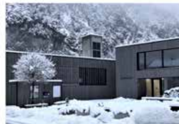
Gemeinde Lorüns Voranschlag 2021

Bei der Erstellung des Voranschlags 2021 wurden entsprechend der Beratung des Finanzausschusses und der daraufhin erfolgten Beratung in der erweiterten Gemeindevertretungssitzung vom November nur die unbedingt notwendigen bzw. aus wirtschaftlicher Sicht vertretbaren Vorhaben und Investitionen berücksichtigt.