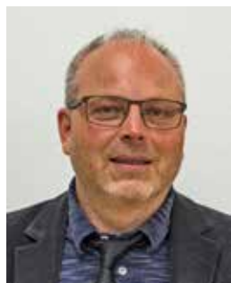
Vizebürgermeister Schuh Otto